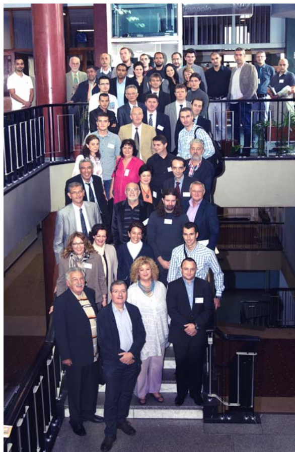
Participants at the NT2F14 conference